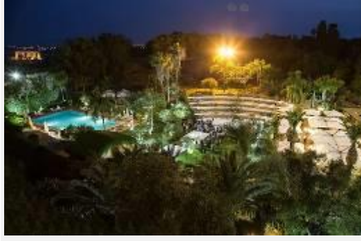
HOTEL DELLA VALLE