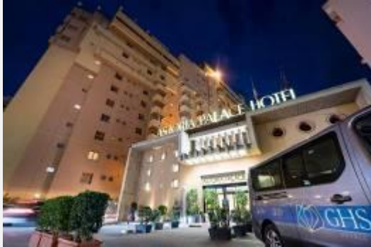
HOTEL ASTORIA PALACE 4*